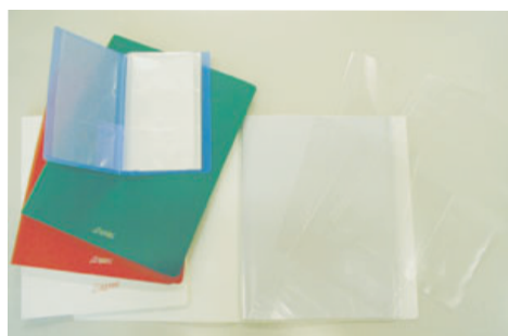
▲ファイルの用途例