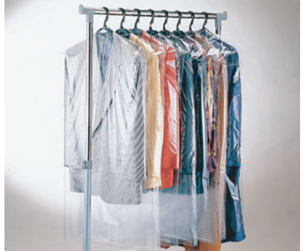
●ハンガーカバー用(ストレッチ)