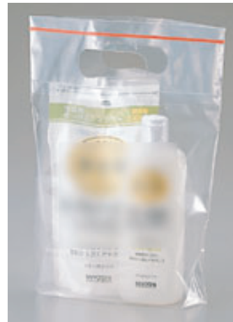
●キャンペーンバッグ用(ハイソフト)